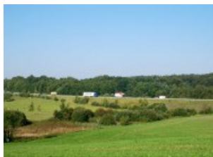
Fotoet viser motorvejsdæmningen ved Taulov – var vejen dog i det mindste blevet ført over Elbodalen på en bro! Nu virker den som en spærring for alt dyreliv.

Region Syddanmark har for nylig udgivet et magasin, som lader hånt om de analyser, som flere ingeniørfirmaer har foretaget. Professorens og Infrastrukturkommissionens anbefalinger gør heller ikke indtryk. Den "syddanske" trafikmafia provokerede os i en sådan grad, at vi skrev en artikel – se den her (/Admin/Public/DWSDownload.aspx?File=%2fFiles%2fFiler%2fLokale_afdelinger%2fFredericia%2f2011%2f201110%2fNye_trafikmafiaer_grabser.pdf) . Den er sendt til Jyllands-Posten. Se i øvrigt vores omtale af Lillebælt-broplanerne i juni-nummeret her .