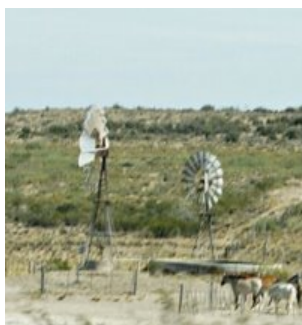
Vindrosen er fotograferet på Pampassetten i Argentina

Husstandsvindmøller er på ingen måde noget nyt i Danmark, idet mange gårde allerede sidst i 1800-tallet opstillede såkaldte vindroser – de fleste til at pumpe vand op, men senere også nogle til at drive el-generatorer. Alle ved, hvordan en moderne vindmølle ser ud. Så vi har valgt at vise en vindrose Måske er der stadig nogle få i Danmark.