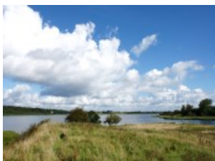
Fotoet er taget fra det nu nedbrudte fugletårn ved Fager LIen

Vi har spurgt kommunen, hvad den vil gøre ved problemet, men strategien er endnu ikke besluttet.